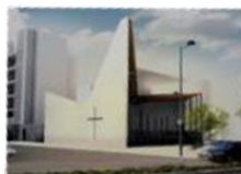
N.D du Lac